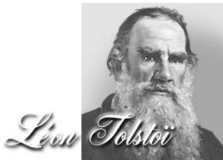
Léon Tolstoï écrivain russe auteur de « Guerre et Paix »

Depuis ses débuts jusqu'à nos jours, de nombreuses personnalités ont soutenu l'espéranto :