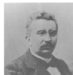
Louis Lumière inventeur du cinématographe