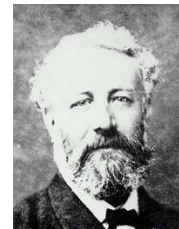
Jules Verne auteur de « 20 000 lieues sous les mers »